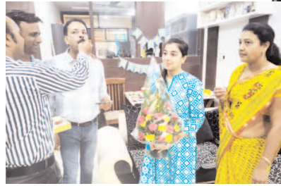
हेतु कई पढ़ाव पर करते होते है आपको मानसिक और शारीरिक रूप से मजबूत